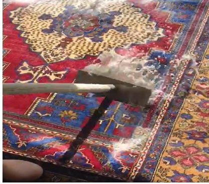
Fotoğraf 15. Halıdan gelbere ile suyun ayrıştırılması (Kılıç Karatay 2023)