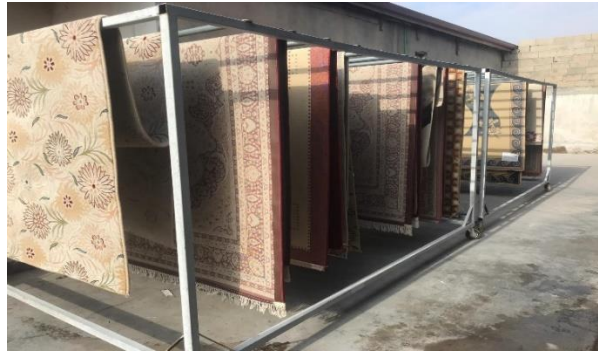
Fotoğraf 18. Yıkanan halıların kurutma tezgâhlarına asılması (Kılıç Karatay 2023)