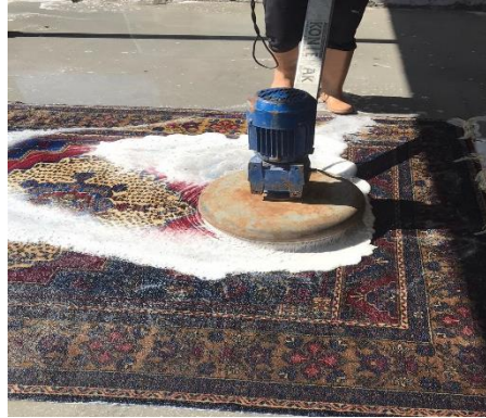
Fotoğraf 14. Halının sırt kısmından yıkanması işlemi (Kılıç Karatay 2023)