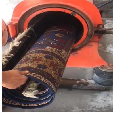
Fotoğraf 16. Halının sıkma makinesine yerleştirilmesi (Kılıç Karatay 2023)